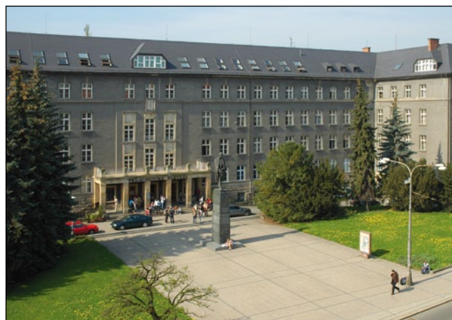
Pedagogická fakulta Univerzity Palackého v Olomouci

Pedagogická fakulta Univerzity Palackého v Olomouci Centrum celoživotního vzdělávání Žižkovo náměstí 5, P.O. box 212, 771 40 Olomouc